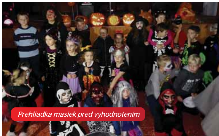
Prehliadka masiek pred vyhodnotením