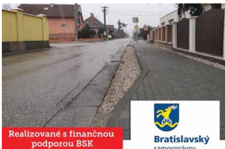
Realizované s finančnou podporou BSK

Klimatické zmeny sú čoraz častejšie badateľné už aj nás. Narastajúci počet obyvateľov spolu so zväčšujúcou sa zastavanou plochou spôsobuje, že v čase nárazových búrok a privalových dažďov nemá jednoducho voda kam otekať. Donedávna patrila k najhorším úsekmi miestnych komunikácií v obci aj Poštová ulica. Obec Veľký Biel získala v tomto roku finančnú dotáciu z Bratislavského samosprávneho kraja, v rámci Bratislavskej regionálnej dotačnej schémy na podporu Životného prostredia a rozvoja vidieka 2019 vo výške 8.200€. Tieto finančné prostriedky boli použité v súlade s účelom poskytnutia dotácie, a to realizáciou adaptačných opatrení zameraných na zadržiavanie dažďovej vody na Poštovej ulici. Počas privalových dažďov tu dochádzalo k problémom s odtokom vody, na vozovke a vo výtlkoch sa vytvárali kumulované plochy so zadržiavaním veľkého množstva zrážok. Osadením vsakovacích blokov a uličných vpustov s odlučovačom ropných látok došlo k vybudovaniu odvodňovacieho systému. Prínosom projektu je, že dažďová voda už nepreteká na príslahlé pozemky obyvateľov, nepoškodzuje tak ich nehnuteľnosti a zároveň sa zvýšila plynulosť a bezpečnosť cestnej premávky.