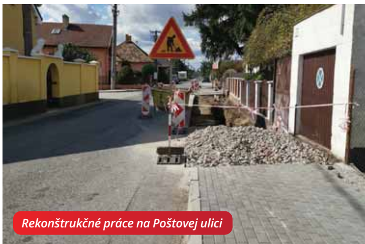
Rekonštrukčné práce na Poštovej ulici

Ďalším veľkým a úspešne ukončeným projektom je výstavba kanalizačnej siete na Kostolnej a Polovničkej ulici. Zároveň máme vypracovanú projektovú dokumentáciu na potrebné rozširovanie čističky odpadových vôd a pripravujeme projekty na budovanie kanalizácie na zostávajúcich uliciach. Počas tohto roka sme urobili opatrenia, potrebné na odvodnenie ulíc Krátka a Poštová, ktoré zostávali po privalových dažďoch dlhšiu dobu plné stojacej vody.