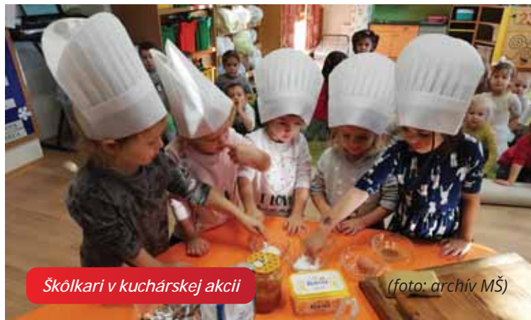
Škôlkari v kuchárskej akcii

Je pre nás veľkým šťastím, že môžeme sledovať, ako deti prežívajú vianočné prípravy. Možno práve to je cesta k tomu, aby sme si znovu spomenuli na ozajstné čaro Vianoc. Želáme Vám, aby ste sa dokázali čo najviac priblížiť dieťaťu v sebe a aby pre Vás boli Vianoce také čarovné a plné splnených zázrakov ako pre deti v našej materskej škole.