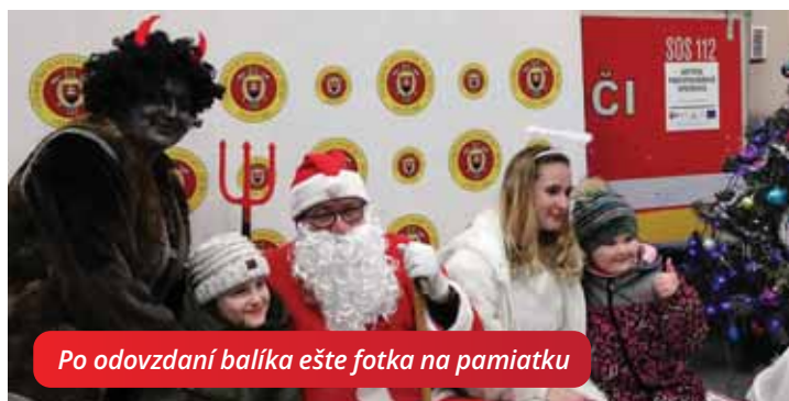
Po odovzdaní balíka ešte fotka na pamiatku