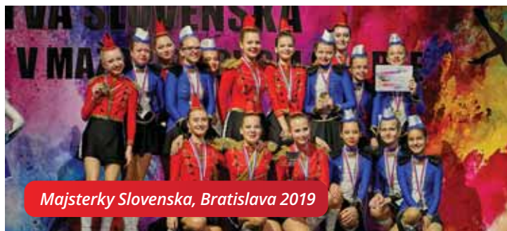
Majsterky Slovenska, Bratislava 2019