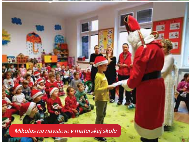
Mikuláš na návšteve v materskej škole