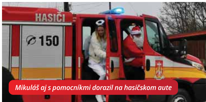
Mikuláš aj s pomocníkmi dorazil na hasičskom aute

V sobotné popoludnie, 7.12. čakali menšie i väčšie deti pri požiarnej zbrojnici v Malom Bieli s napätím na príchod Mikuláša. A ten teda nesklamal. Priviezol sa spolu s anjelom priam pompézne s húkajúcou sirénou a blikajúcim majákom na hasičskom aute. Hneď ich hrešil rohatý čert zato, že meškali a tak neváhali a hneď sa pustili do rozdávania mikulášskych balíčkov. Nebolo to však len tak, čert vyžadoval básničku či pesničku a bol zvedavý či deti poslúchali. Niektoré menšie detičky sa Mikuláša a čerta trochu báli, iné zas boli odvážne a ťahali čerta aj za chvost. Čert aj tým menej odvážnym deťom ukázal, že sa ho báť ozaj netreba a zabával ich popri fotení sa s Mikulášom a anjelom a rozdával sladké balíčky. Vonku hrala vianočná hudba, rozvonivala varená klobáska, párky, varené víno a čaj. Atmosféra bola opäť na jednotku a my veríme, že ste si rovnaký zážitok odniesli aj Vy.