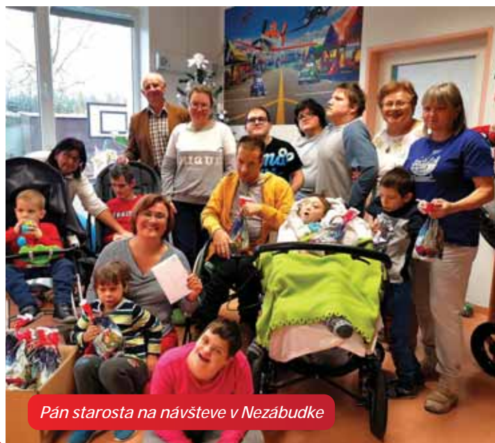
Pán starosta na návšteve v Nezábudke

V piatok 06.12.2019 navštívil pán starosta ako bielsky Mikuláš s anjelom a čertom tradične všetky poslušné deti v základnej i materskej škole a obdaroval ich sladkým mikulášskym balíčkom. Nezabudol ani na deti v dvoch súkromných škôlkach a v parku pri kultúrnom dome. Nevynechal ani školskú jedáleň, poštu či obecný úrad. V pondelok pán starosta ako každoročne, navštívil Dom Nezábudka - domov sociálnych služieb, kde okrem mikulášskych balíčkov odovzdal aj finančný dar. Obecný Mikuláš tak rozdal spolu 400 mikulášskych balíčkov.