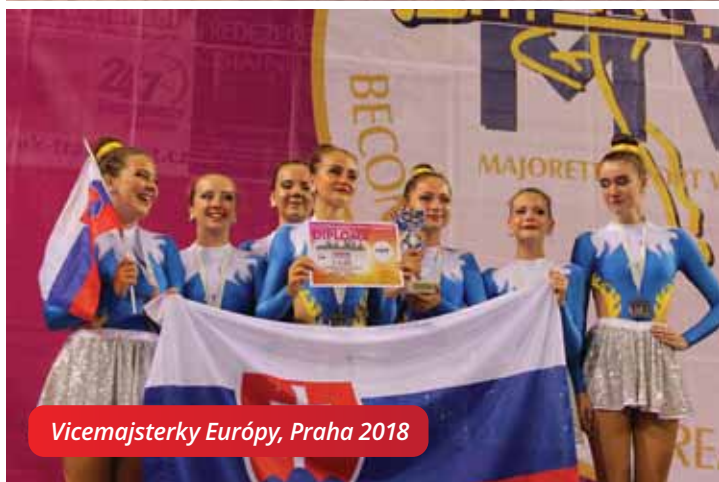
Vicemajsterky Európy, Praha 2018