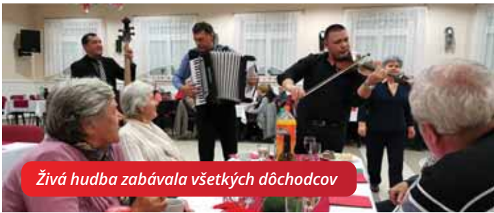
Živá hudba zabávala všetkých dôchodcov