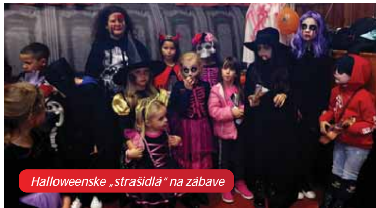
Halloweenske „strašidlá“ na zábave