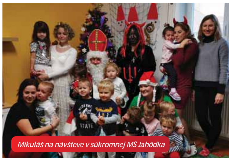
Mikuláš na návšteve v súkromnej MŠ Jahôdka