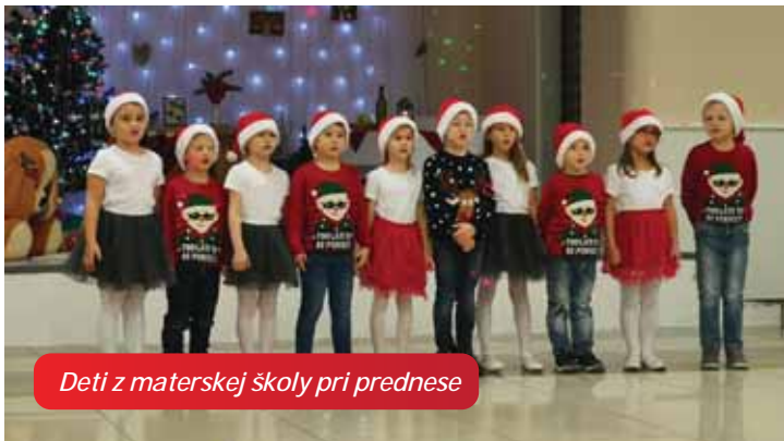
Deti z materskej školy pri prednese

V súvislosti s vianočným posedením seniorov sa medzi občanmi začali šíriť klebety, prečo bol pozvaný ten a prečo nebola pozvaná tá. Je tomu tak z jednoduchého dôvodu. Seniorov len nad 70 rokov je v obci takmer 270. Z kapacitných dôvodov nie je možné naraz pozvať všetkých, preto budeme na nasledujúce stretnutia pozývať postupne aj ostatných seniorov. Ďakujeme za pochopenie a tešíme sa na Vás nabudúce.