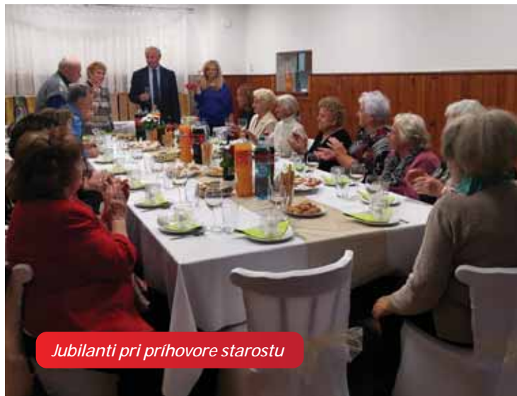
Jubilanti pri príhovore starostu

A községi hivatal a szociális és egészségügyi bizottsággal karoltva 2019. november 9-én, szombaton tizenkettedik alkalommal köszöntötte a település jubilánsait. Húsz magyarbéli és németbéli személy kapott meghívást, akik az idei évben töltötték be a 80-ik vagy a 85-ik életévüket. A jubilánsokat az óvodások az igazgatónő vezetésével kedves programmal köszöntötték. Gratulálunk és erőt, egészséget kívánunk nekik!