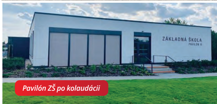
Pavilón ZŠ po kolaudácii