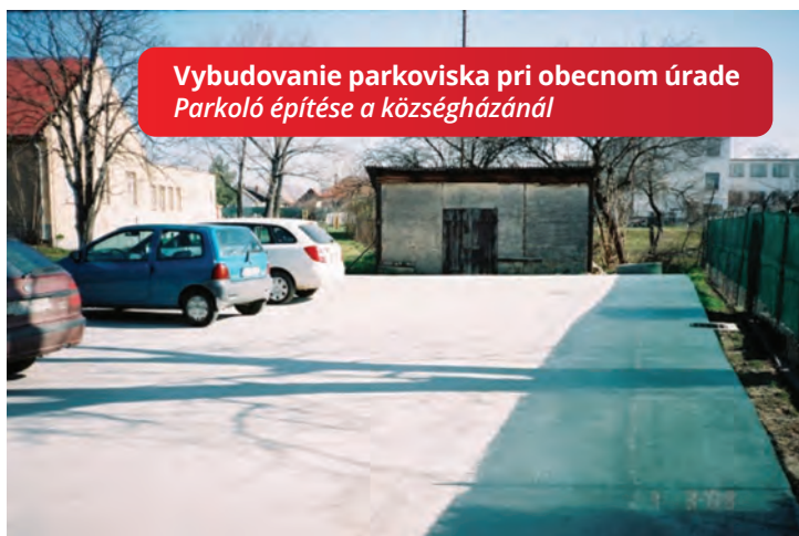
Vybudovanie parkoviska pri obecnom úrade Parkoló építése a községházánál