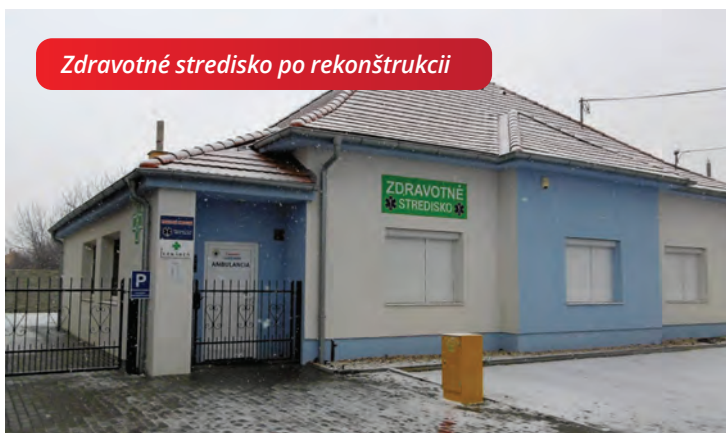
Zdravotné stredisko po rekonštrukcii