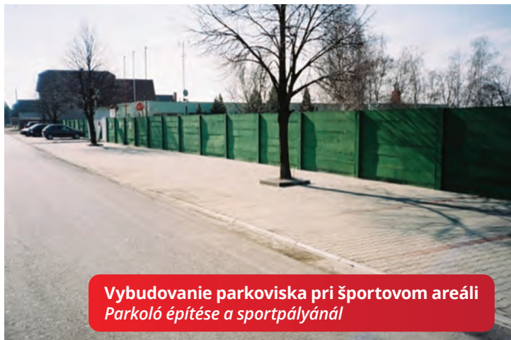
Vybudovanie parkoviska pri športovom areáli Parkoló építése a sportpályánál