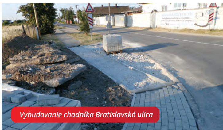
Vybudovanie chodníka Bratislavská ulica