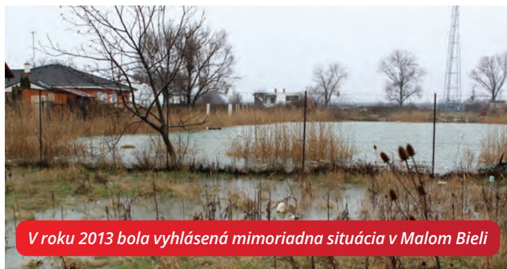
V roku 2013 bola vyhlásená mimoriadna situácia v Malom Bieli