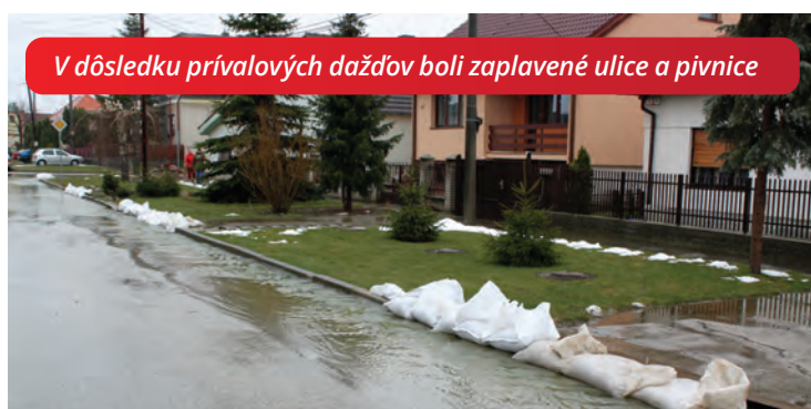
V dôsledku privalových dažďov boli zaplavené ulice a pivnice