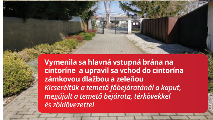
Vymenila sa hlavná vstupná brána na cintoríne a upravil sa vchod do cintorína zámkovou dlažbou a zeleňou Kicseréltük a temető főbejáratánál a kaput, megújult a temető bejárata, térkövekkel és zöldévezettel