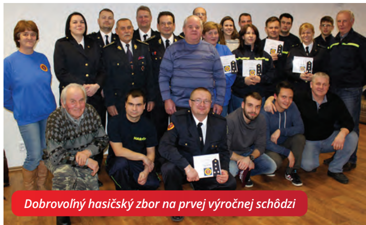
Dobrovoľný hasičský zbor na prvej výročnej schôdzi