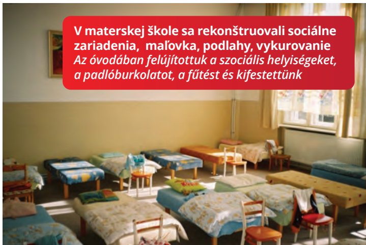
V materskej škole sa rekonštruovali sociálne zariadenia, maľovka, podlahy, vykurovanie Az óvodában felújítottuk a szociális helyiségeket, a padlóburkolatot, a fűtést és kifestettünk