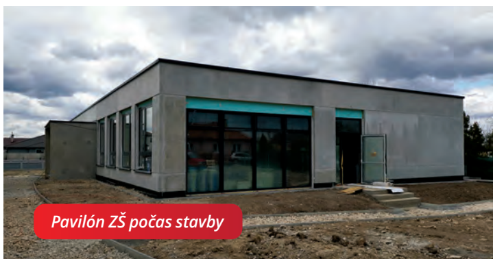
Pavilón ZŠ počas stavby