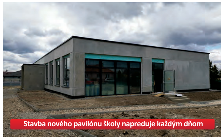
Stavba nového pavilónu školy napreduje každým dňom

Veríme, že sme vám týmto článkom priblížili tému podielových daní a obecného rozpočtu. Pre podrobnejšie informácie o rozpočtoch obce Veľký Biel navštívte webovú stránku obce www.velkybiel.eu . V sekcii Samospráva/Rozpočet a hospodárenie nájdete všetky rozpočty, záverečné účty a výročné správy. O plánoch zveľaďovania obce v roku 2019 Vás budeme určite informovať prostredníctvom obecných novín a internetovej stránky.